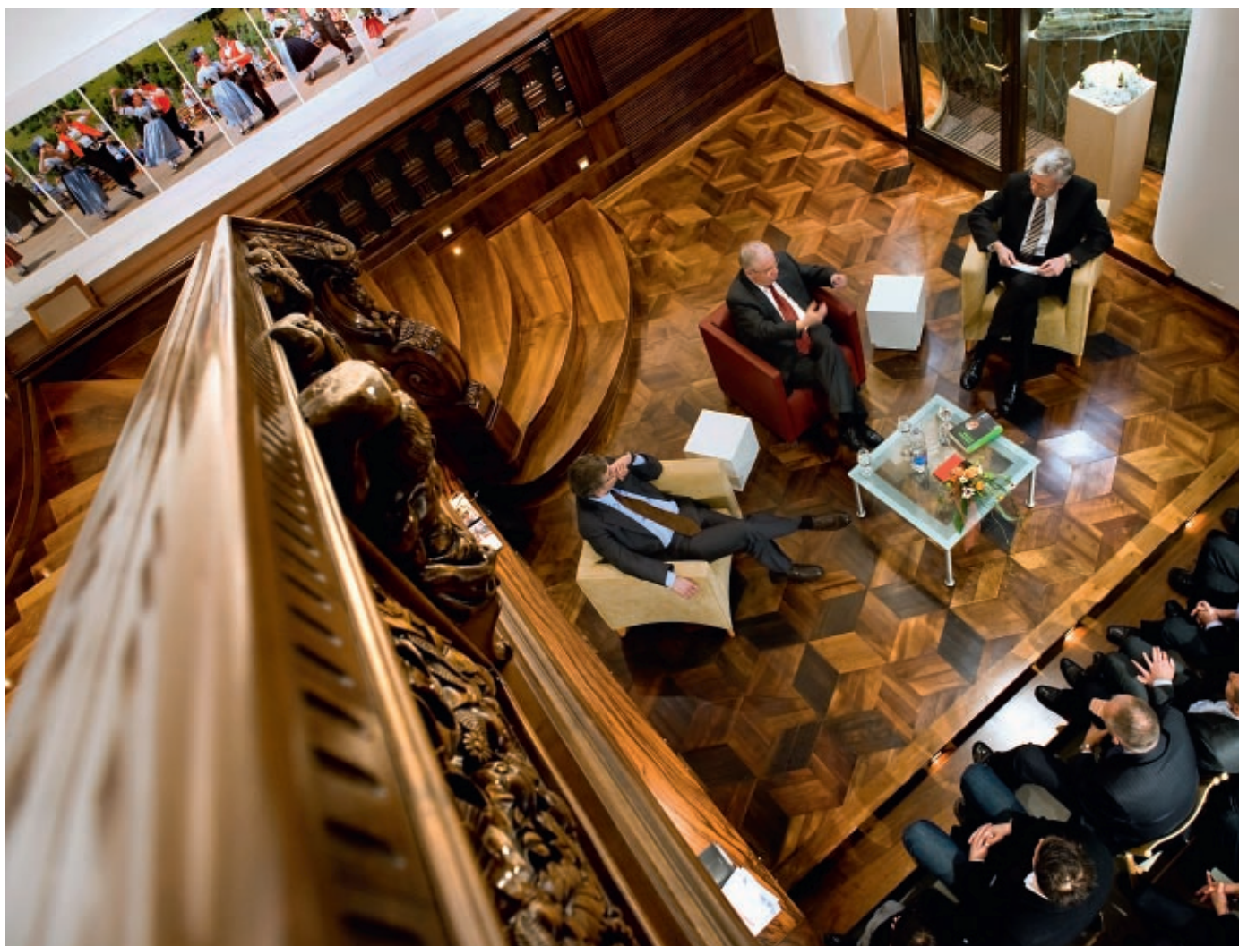
Autor Markus Somm, Christoph Blocher und Verleger Marcel Steiner (v.l.): Buchpräsentation vor Journalisten im Haus Appenzell, Zürich.

Schweiz in den letzten dreissig Jahren neu zu schreiben, respektive neu zu interpretieren, wie er betont. «Manche kritisieren, dass ich die Schweiz ausgerechnet mit Amerika verglichen habe.» Dabei verbindet die beiden Schwester-Republiken einiges: Sie sind seit jeher Republiken und gehen nicht auf Monarchien zurück, die schweizerische Bundesverfassung (1848) lehnt sich an die amerikanische (1787) an, und beide Staaten verfügen über stark föderalistisch geprägte politische Systeme. «Amerikaner und Europäer nehmen das Gleiche unterschiedlich wahr. Ein grosser Vorteil des Westens ist, dass wir diese zwei Abteilungen haben, Amerika und Europa. Deshalb sollten wir ab und zu auch einen Vergleich vornehmen.» Betrachtet man die innenpolitische Entwicklung der letzten 30 Jahre in den USA, sticht einem die konservative «Revolution» der Republikaner ins Auge.